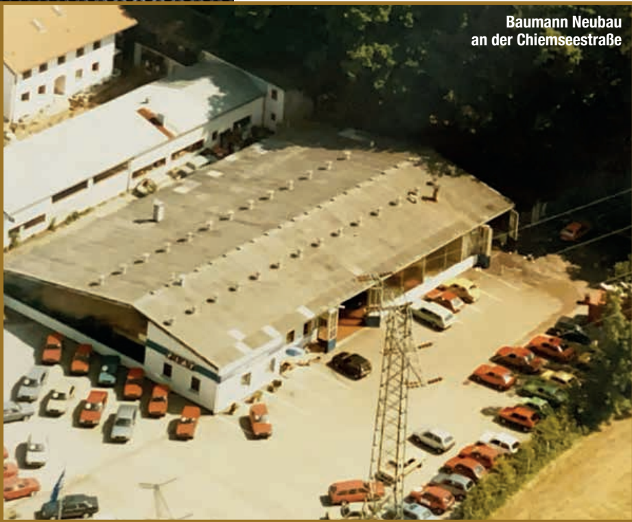
Baumann Neubau an der Chiemseestraße