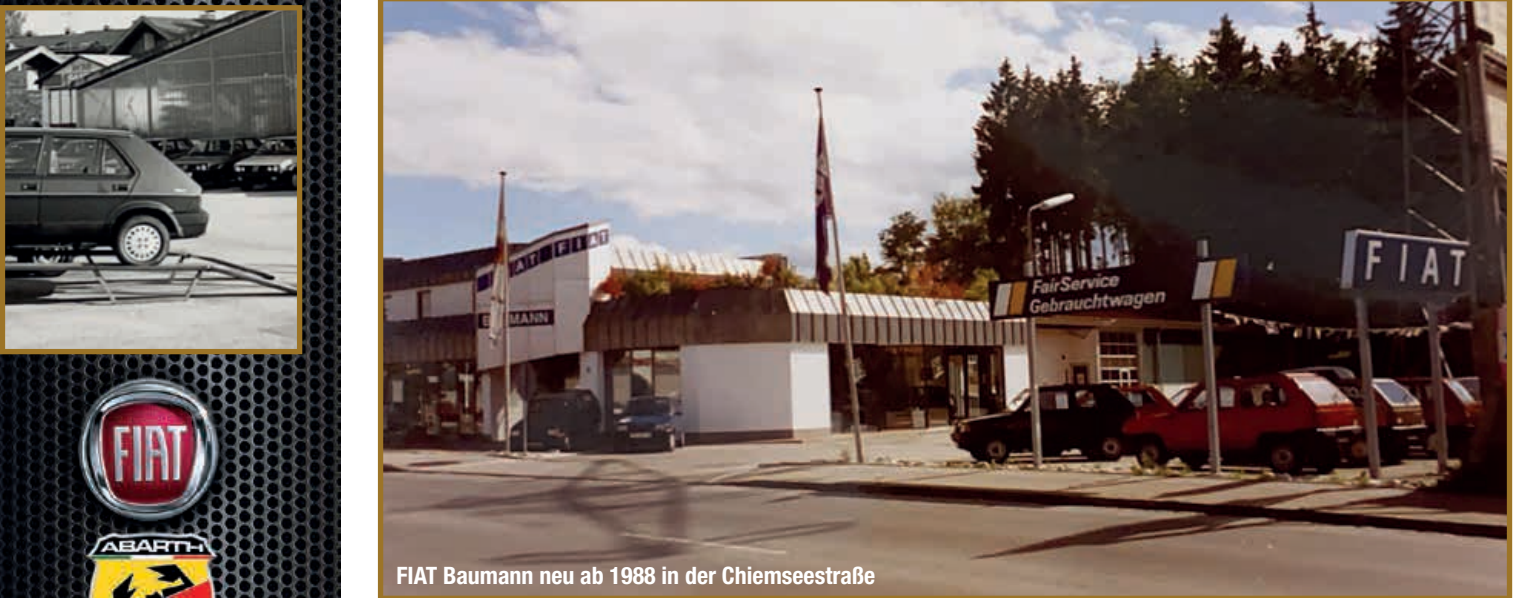
FIAT Baumann neu ab 1988 in der Chiemseestraße