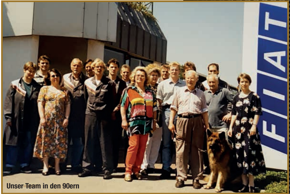
Unser Team in den 90ern

Als die Geschäftsräume mit der relativ kleinen Kfz-Werkstatt an der Herzog-Friedrich-Straße im Laufe der Jahre nicht mehr ausreichten, übersiedelte Jakob Baumann jun. in die Chiemseestraße 7, wo er 1972/1973 auf dem neuerworbenen, weiträumigen Gelände einen modernen Kfz-Betrieb mit Ersatzteillager und Gebrauchtwagenmarkt erstellte, den er 1988 um eine repräsentative knapp 400 Quadratmeter große Ausstellungshalle für FIAT-Neufahrzeuge erweiterte.